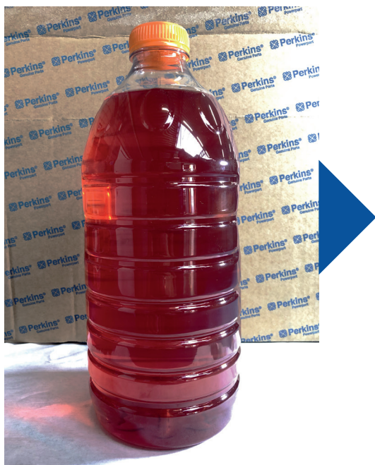
HDPS - Hunter & Van Twist

Met de opkomst van biofuels en het verlagen van het zwavelgehalte in de brandstof hebben algen vrij spel om te groeien in de brandstoftank.